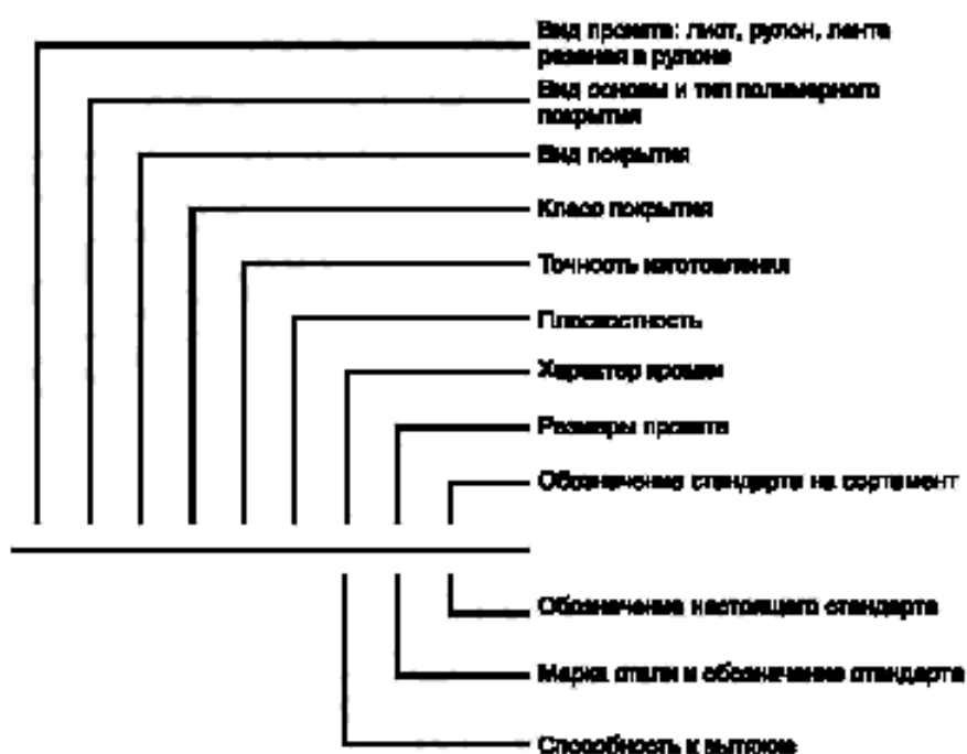
Схема условных обозначений проката с полимерным покрытием

Примечание — При отсутствии какого-либо из параметров его выбирает предприятие-изготовитель.