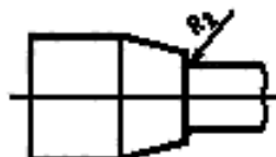
Рисунок 2 — Головка образца с переходным участком

Для спеченных изделий рекомендуется использовать образец для испытания с двумя переходными частями на каждом конце. Радиус сопряжения R_2 рабочей части с переходным участком головки образца должен быть от 1,5 до 5 мм (рисунок 2).